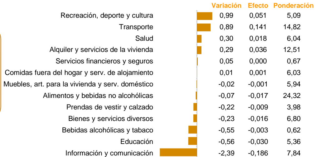
Costa Rica. Variación porcentual, efecto y ponderación por división, mayo 2021

En mayo del 2021, de las trece divisiones que conforman el índice, siete presentaron disminuciones de precios.